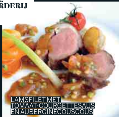
LAMSFILET MET TOMAAT-COURGETTESAUS EN AUBERGINE COUSCOUS